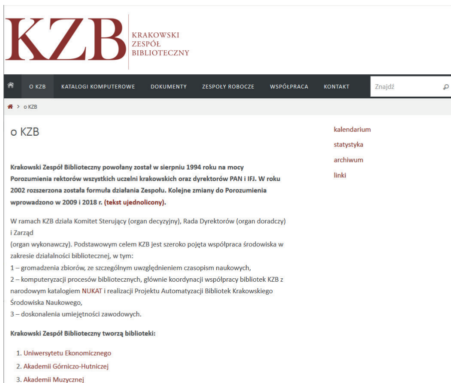
Rys. 1. Strona internetowa KZB