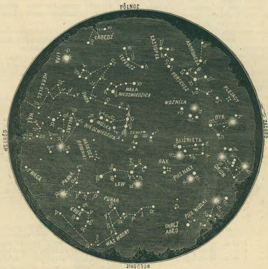
Karta nieba na miesiąc Kwiecień.

TYGODNIK POPULARNY, POŚWIĘCONY NAUKOM PRZYRODNICZYM.